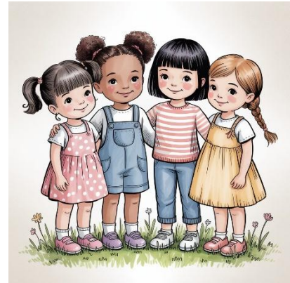
Obrázok 1:

Guľičky si dievčatá nakupujú vo vrecúšku, pričom ich celkový počet je stanovený predajcom a teda môže byť rôzny. Dievčatá si tieto guľičky nafarbia podľa potrebnej farby. Jeden náramok priateľstva dievčatá vytvárajú práve z jedného kúpeného vrecúška a vždy chcú, aby v ňom bolo čo najviac guľičiek. Avšak nie vždy vedia, koľko guľičiek z vrečka je potrebné nafarbiť. Keďže nechcú míňať farbami, potrebujú vytvoriť program na kreslenie náramkov. Vedel by si im s tým pomôcť?.